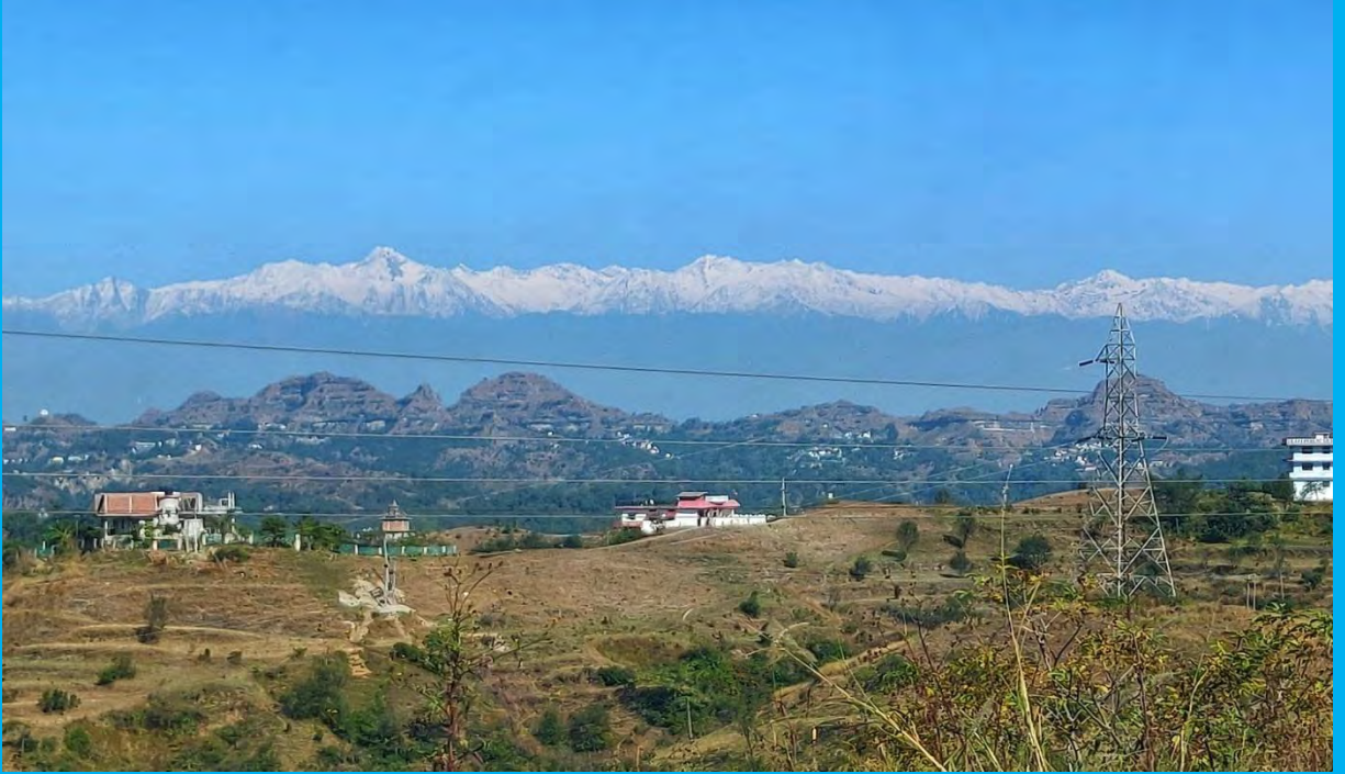
View of a Village of Sujanpur Block

जिला सांख्यिकीय कार्यालय हमीरपुर हिमाचल प्रदेश