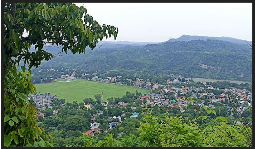
A View of Sujanpur Town

जिला सांख्यिकीय कार्यालय हमीरपुर हिमाचल प्रदेश