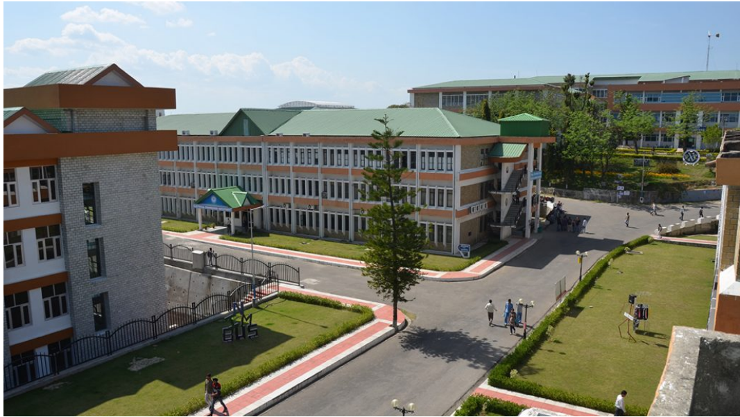
A View of NIT Hamirpur

जिला सांख्यिकीय कार्यालय हमीरपुर हिमाचल प्रदेश