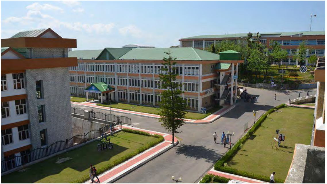
A View of NIT Hamirpur

जिला सांख्यिकीय कार्यालय हमीरपुर हिमाचल प्रदेश