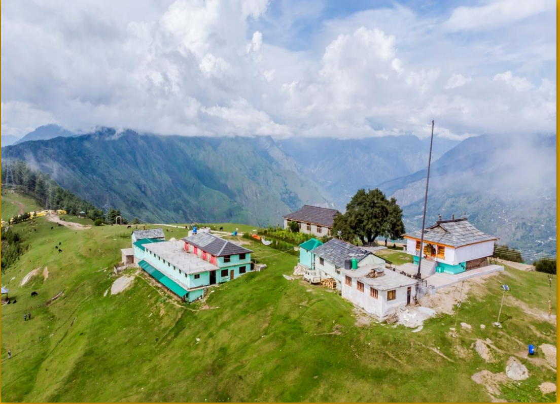
बिजली महादेव मन्दिर कुल्लू

जिला सांख्यिकीय कार्यालय, कुल्लू, जिला कुल्लू (हि0प्र0)