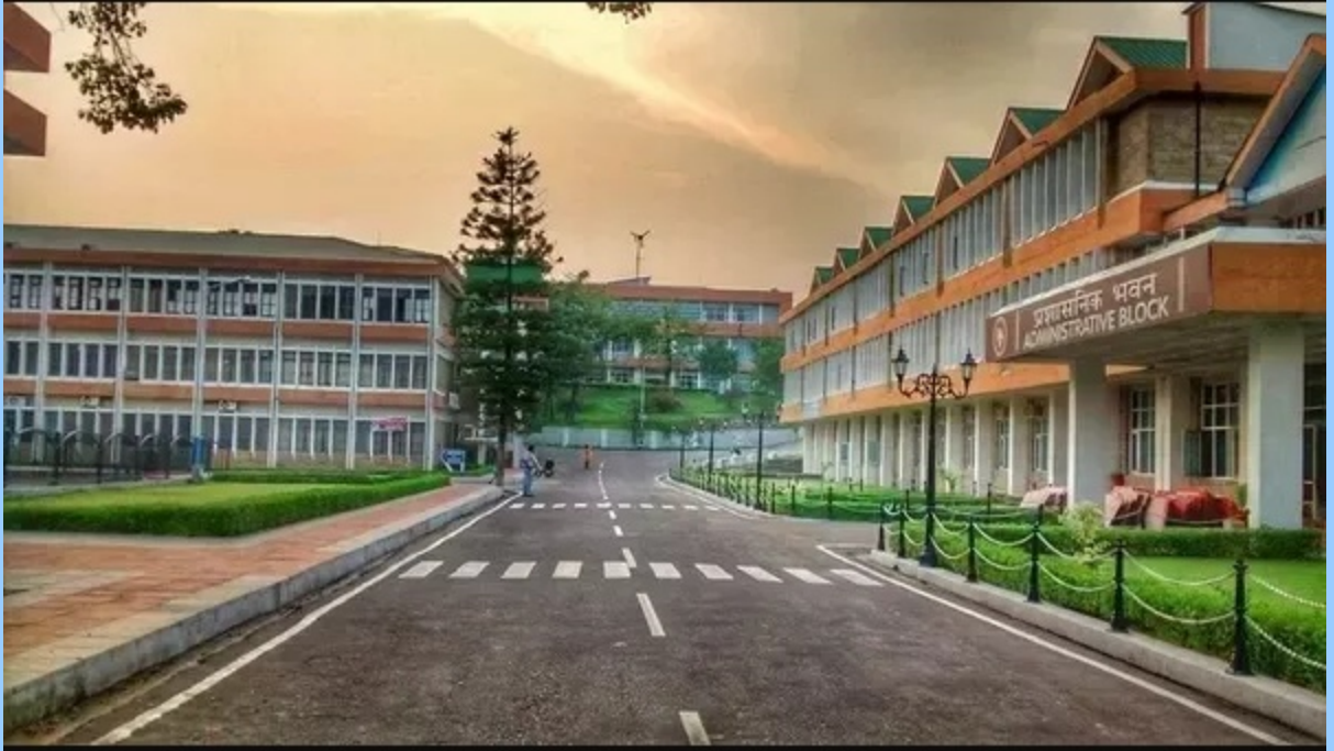
A View of NIT Hamirpur (H.P)

जिला सांख्यिकीय सारांश-2023 जिला हमीरपुर